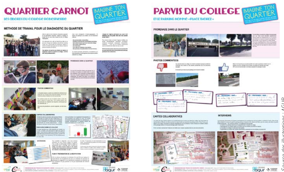
Les panneaux réalisés pour la fête du collège Robespierre rendent bien compte de l'ensemble des activités menées durant l'année scolaire par les 2 classes de 6 ème .

A l'issue de la diffusion de la vidéo, les débats ont porté sur la notion de temps, de durée . Les échanges ont aussi fait émerger l'importance de cadrer en amont le participation des publics, jeunes ou moins jeunes, aux projets.