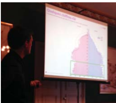
Une quarantaine de participants ont échangé autour de la question de l'association des jeunes aux projets publics.