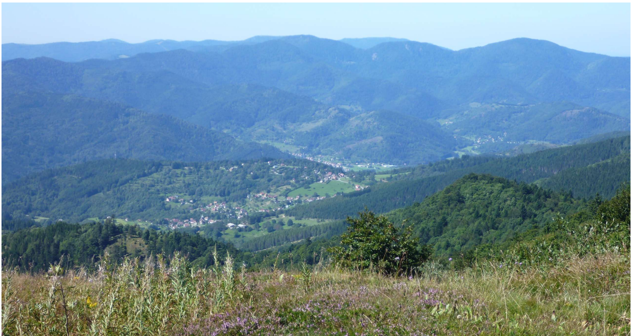
Les villages de la vallée de la Thur dans leur écrin paysager, vus de la route des crêtes (68).