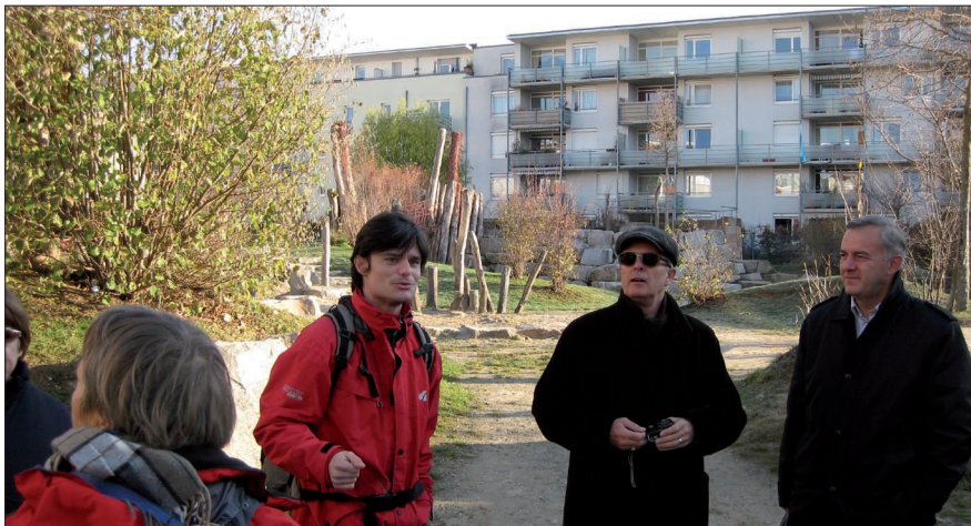
Lors des visites dans le quartier du Riesenfeld, le 27 novembre 2008.