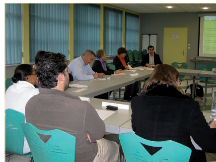
Lors d'un atelier, le 28 novembre 2008.

Lettre d'information trimestrielle éditée et imprimée par : L'Agence d'Urbanisme de la Région Mulhousienne 33 Grand'Rue • 68100 MULHOUSE Tél : 03 89 45 90 00 • Fax : 03 89 46 21 51 Directeur de la publication : Reynald BAVAY Directeur de la rédaction : Cécile LEHR-COQUET Rédaction : Equipe de l'Agence ISSN : 1255 - 7323 Dépot légal : à parution Toute reproduction autorisée avec mention précise de la source et la référence exacte.