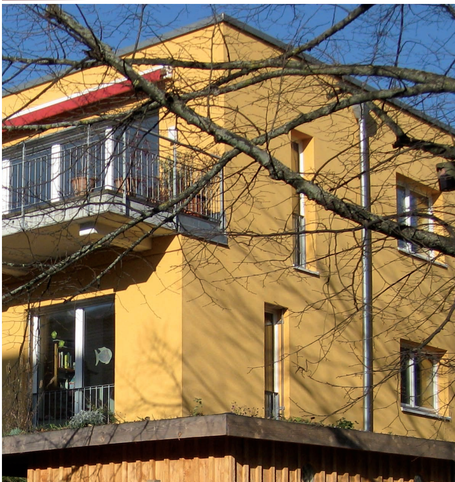
Exemple de réalisation dans le quartier Vauban à Fribourg.