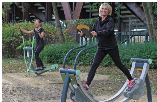
Le "sport-santé" en plein air connaît lui aussi un fort développement : ici à Mulhouse, des agrès en libre accès ont été installés le long de l'III.