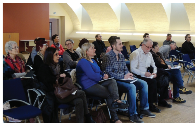
Le sport peut-il rapprocher les jeunes, les associations et les collectivités locales ? Les participants ont débattu de cet enjeu pendant l'événement.