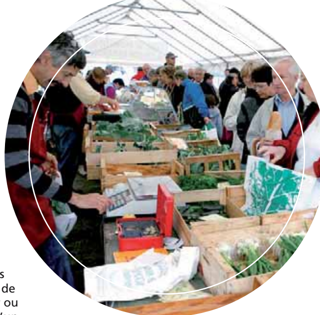
Marché de Pugey

La production agricole est en majorité valorisée par des filières longues, pour une commercialisation nationale ou internationale. Pourtant, des consommateurs toujours plus nombreux souhaitent connaître l'origine de leur alimentation, son mode de production, échanger avec l'agriculteur ou le transformateur. Ces circuits courts s'accompagnent également d'un rapprochement géographique entre lieu de production et de consommation permettant de limiter les distances de transport des marchandises.