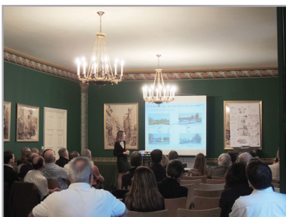
Une quarantaine de participants, pour débattre d’un sujet qui peut concerner toutes les communes

Comment des lieux désaffectés peuvent devenir une opportunité et générer ou prolonger une dynamique sur une commune ou un territoire ? En quoi laisser du temps au projet n’est pas nécessairement qu’un aléa économique mais peut contribuer à enrichir le projet ?