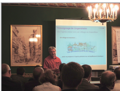
Le témoignage de deux communes, l’une rurale, Ungersheim, l’autre urbaine, Riedisheim