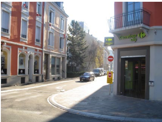
Carrefour City, place Franklin à Mulhouse Le commerce est une thématique relativement récente pour la Politique de la Ville.

Si l'évolution depuis 1999 montre des signes encourageants sur certains indicateurs (baisse de la part des grands ménages, « lissage » de l'indice de jeunesse), les grandes caractéristiques socio-démographiques qui distinguent les ZUS du reste de l'agglomération demeurent : population toujours plus jeune, taux d'activité et niveaux de formation plus faibles... Autant de caractéristiques qui justifient a priori le maintien, sur ces territoires, d'un effort particulier des politiques publiques.