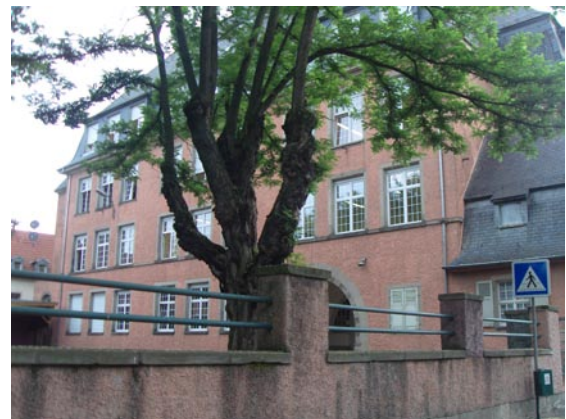
Ecole Kléber, rue Kléber à Mulhouse L'éducation reste un secteur porteur de nombreux enjeux pour les CUCS de m2A.