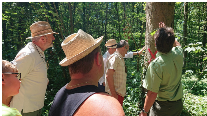
Le Syndicat Intercommunal Forestier de l'Agglomération Mulhousienne (SIFAM) communique auprès des promeneurs sur les enjeux de la gestion de la forêt

La forêt possède 3 fonctions, économique (bois), sociale/récréative (accueil du public) et écologique (faune et sa flore). Dès lors, comment gérer cet espace dans lequel un nombre important d'acteurs évolue ? Comment contribuer à la cohabitation de ces 3 fonctions ?