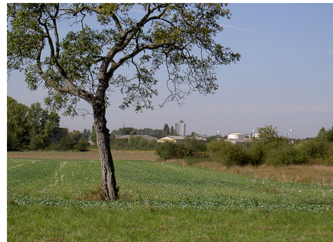
La campagne aux portes de la ville à Riedisheim