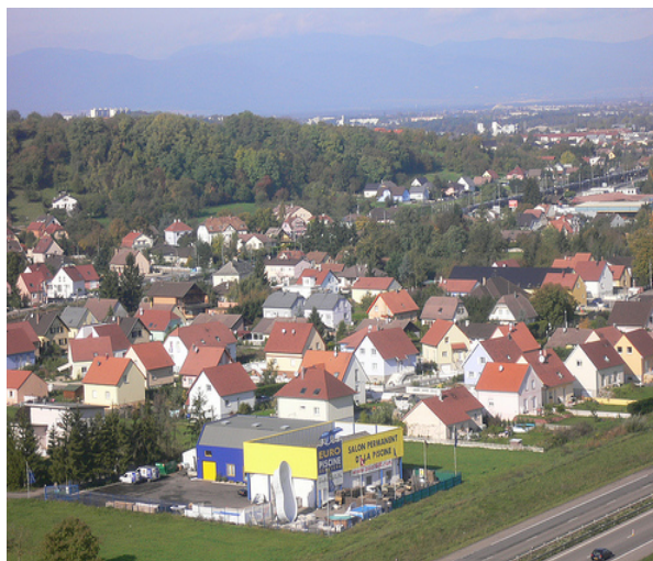
Habsheim : vue aérienne

En 2009, l'Agence participera très activement à l'évaluation des besoins en logements et en logements sociaux notamment pour le compte de la communauté d'agglomération, délégataire des aides à la pierre. Elle aura aussi pour mission la révision du PLH de la communauté de communes des Collines .