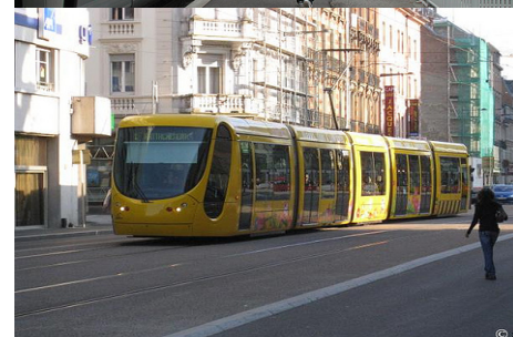
Le tram à Mulhouse