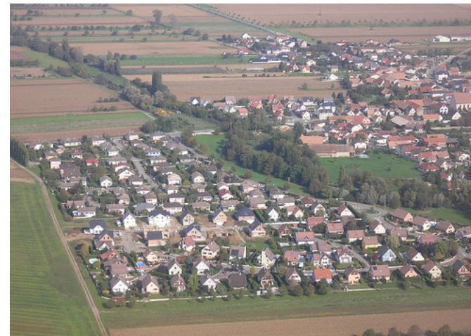
Battenheim, vue aérienne

L'Alsace et Mulhouse font ainsi référence en France. Des professionnels, des acteurs politiques venus de toutes les régions s'y donnent rendez-vous, s'enrichissent de l'expérience de deux pays frontaliers qui abritent des quartiers d'excellence écologique. L'Agence accueille et organise des séminaires de formations dont elle fait profiter aussi les acteurs locaux.