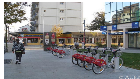
Mulhouse : les « vélocités » Avenue de Colmar

L'enquête ménage déplacement est en cours de dépouillement au cours des années 2009 et 2010, l'Agence apportera son analyse et son expertise. La somme d'informations sur les déplacements quotidiens des habitants de l'agglomération mulhousienne est importante. L'Agence, avec les acteurs locaux concernés, disposera d'indicateurs précieux propres à alimenter les choix des décideurs locaux pour les prochaines décennies.