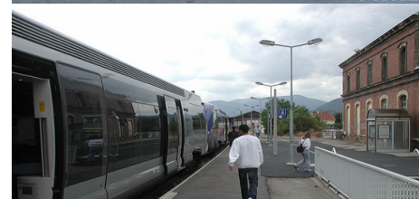
Le train à Cernay