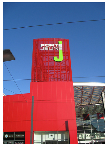
Mulhouse, Porte Jeune

est désormais lancée. L'Agence doit animer cette procédure et poursuivre l'étude expérimentale sur la requalification des pôles commerciaux ; après l'identification des outils et méthodologies. Une réflexion sur la transposition éventuelle de la démarche aux tissus commerciaux de centres villes et centres bourgs est à mener.