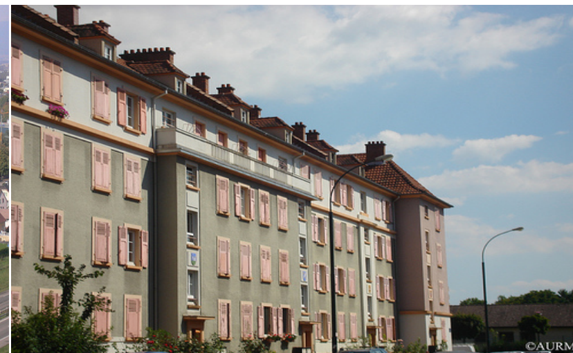
Mulhouse : quartier Drouot