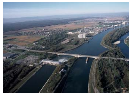
Le Rhin à Ottmarsheim, vecteur de développement.