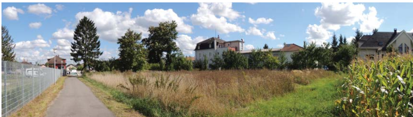
... aux lisières urbaines très marquées et diversifiées : habitat résidentiel, activités, commerces ....