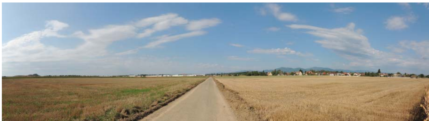
Un espace agricole ouvert de près de 80 hectares ...